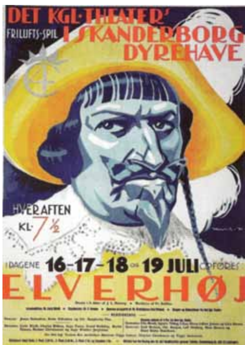
Ved Det kgl. Teaters friluftsspil i Skanderborg Dyrehave i juli 1931 var Elverhøj på programmet. Teaterplakat gengivet efter Skanderborg – kalejdoskopisk set – 1908-2008.

ver bogen et lidt uegalt præg, så meget desto mere som arbejdsgruppen også har valgt at gengive bl.a. en dramatekst om borgmestervalget i byen i 1925. Skuespillet om den fornøjelige konstituering af borgmesterposten, hvor en radikal var udslaggivende, blev opført ved LO's 100 års jubilæum i 2000, er dog lokalhistorisk morskab i topklasse. Den kontroversielle lukning af Skanderborg Sygehus i slutningen af 1980'erne har foruden en artikel om korttegekørslen i 1988 til amtsgården i Højbjerg også givet anledning til,