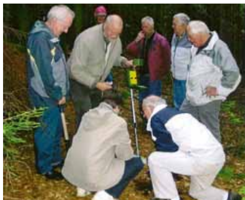
Medarbejderne fra lokalarkiverne sidder ikke blot og registrerer arkivalier. Forsynet med en metaldetektor drog en halv snes medarbejdere fra Galten Egnarkiv i maj 2008 på jagt i Bakkeskoven i Stjær efter levninger fra de spanske soldater, der i 1808 gæstede egnen.

Blandt årbogens artikler må især to bemærkes. Den første er skrevet i anledning af 200-året for de spanske hjælpetroppers ophold i Danmark i 1808. I Stjær skulle der i Bakkeskoven ifølge en hårdnakket overlevering være nogle spaniolergrave og en brønd. Fra Egnarkivets side blev det besluttet at undersøge lokaliteterne udstyret med metaldetektorer. Resultatet var dog nedslående, men omtalen af arrangementet førte til en henvendelse fra en lokalhistoriker i Sejs, der huskede en indførsel i Linås kirkebog for 1809.