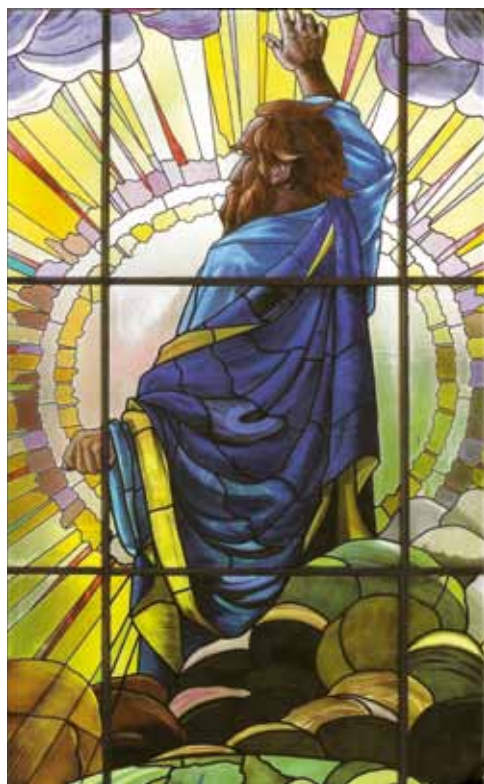
Det store glasmaleri Skabelsen i Logebygningen i Christiansgade i Århus blev lavet i 1908 af glasmester Sørensen i Badstuegade. Udsnit fra bogens forside.

Frimureriet i Århus startede i 1856, da en fabrikant og en militærmusiker fra byen blev optaget i en loge i Aalborg, men ellers er det først i 1861, at der i Århus blev lavet en broderforening af frimurere, der var medlemmer af forskellige loger rundt om i landet. Allerede to år efter blev der lavet en egentlig instruktionsloge, som igen i 1871 blev til Sankt Johanneslogen. I 1908 indviede logen det store ordenshus i Christiansgade, og samtidig blev Sankt Andreaslogen De Fire Roser startet (hvor-