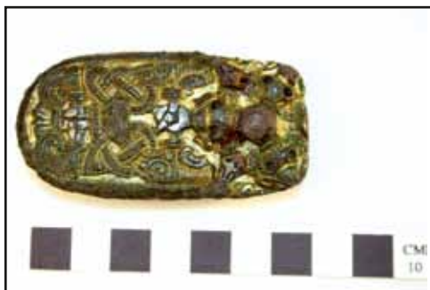
Dette fornemme vikingetidssmykke, som ejermanden sikkert har begravet tabet af, blev fundet af Kulturhistorisk Museum Randers ved en udgravning 10 km syd for Randers.

daterer disse gamle tørvegravninger sig til yngste bronzealder eller ældre førromersk jernalder (omkring 500 f.Kr.). To plankeveje på henholdsvis 16 og 7 m af flåkkede egestammer førte ud i mosen fra den ene bred. Plankerne hvilede på sveller og har kunnet flyttes rundt i mosen som tørvegravningen skred frem.