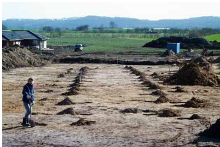
Stolpehullerne i det 43,5 meter lange hus i Grauballe under udgravning

seum i foråret 2007 godt 11.000 kvadratmeter af en landsby fra yngre romersk og ældre germansk jernalder, omkring 4. – 5. årh. e. Kr. Ved udgravningen afdækkedes dele af tre meget store, indhegnede gårde, der har ligget i en øst – vestvendt række hen over en flad bakke. Hegnsforløb mod øst viser, at der formodentlig findes spor efter flere gårde på naboarealerne længere mod øst. Bebyggelsen med de indhegnede gårde er typisk for den yngre del af jernalderen, men gårdsanlæggene og bygningerne er større, end vi kender det fra de fleste andre midtjyske gårde fra denne periode. Et af langhusene, der har været hovedbygning i en af gårdene, var således 43,5 m langt og knap 6 meter bredt og er hermed det hidtil største jernalderhus, der er udgravet i Midtjylland.