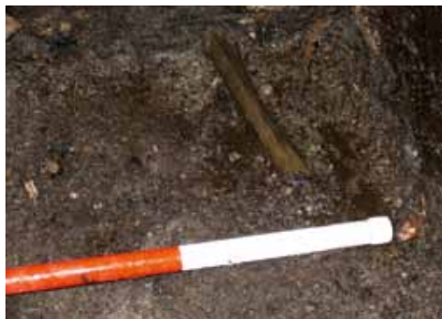
Et lærben stikker ud af et profil ved den gamle søbund ved Vædebro.

2. Årh. f. Kr. til 2. Årh. e. Kr. der ligger blot 1 km mod øst.