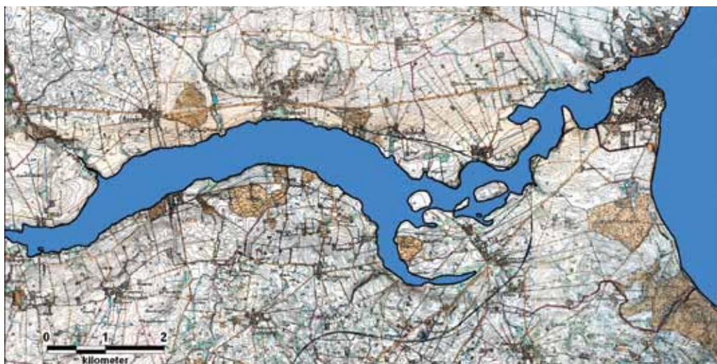
Brabrandfjordens største udbredelse i stenalderen. Den strakte sig 12 km ind i landet fra Århusbugten til Skibby. I fjordens munding opstod en ø af opkastede strandvolde, hvor Århus by senere blev grundlagt. Baggrundskortet er målebordsbladet fra 1870.

Bondestenalderens dysser og jættestuer er ikke bevaret i store mængder i Århusområdet. Derfor er det glædeligt, når vi støder på rester af dem i vores udgravninger. Det skete ved undersøgelserne på et større lokalplansområde syd for Skejby i 2006-07 ved Dusager, et 6,5 hektar stort areal på kanten af et højtliggende plateau ovenfor Egådalen. Dyssens eksistens kendes fra en præsteindberetning til Oldnordisk Museum i København i 1808, og stedsnavnet »Dusager« antyder også tilstedeværelsen af en dysse. Dens nøjagtige beliggenhed var dog ukendt. I udgravningen gav dyssens sig til kende ved store mængder brændt flint på en lille højning samt en 25 m lang række af såkaldte systemgrave, der ellers normalt forbindes med de store samlingspladser