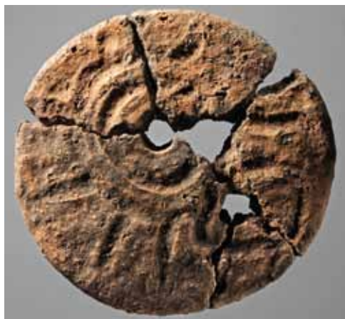
Lerskive med to gennemgående huller og dekoration i form af sol og måne-lignende figurer. Skiven er fundet i en af Dusager-dyssens systemgrave og er formodentlig en form for offergave i en sen fase af dyssens brugstid ca. 2800 f.Kr.

I efteråret 2008 kom Moesgård Museum atter i berøring med den gamle fjord i forbindelse med tre kommunale anlægsarbejder ved henholdsvis Åby Renseanlæg, Bymuseet i Carl Blochs Gade og på den gamle godsbanegård imellem Carl Blochs Gade og Sonnesgade. Ret hurtigt viste det sig, at man stod over for en enestående mulighed for at få belyst fjordområdets historie på ny. Der var gode chancer for arkæologiske fund fra forskellige perioder, og de tykke aflejringer i fjorddalen var velegnede til naturvidenskabelige analyser. På et tidspunkt efter ertebøllefolkernes tid er fjordmundingen sandet til, og vi må forestille os, at fjorden langsomt har ændret sig til et ferskvandsområde. Men hvornår og hvor hurtigt denne udvikling har fundet sted, vides ikke præcist