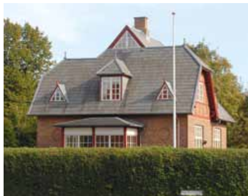
Hjemmet på Paludan-Müllers Vej 4 i dag. Vildvinen er nu fjernet og de typiske detaljer (bindingsværket, de trekantede vinduer og cirkelmønstrene) er igen tydelige.