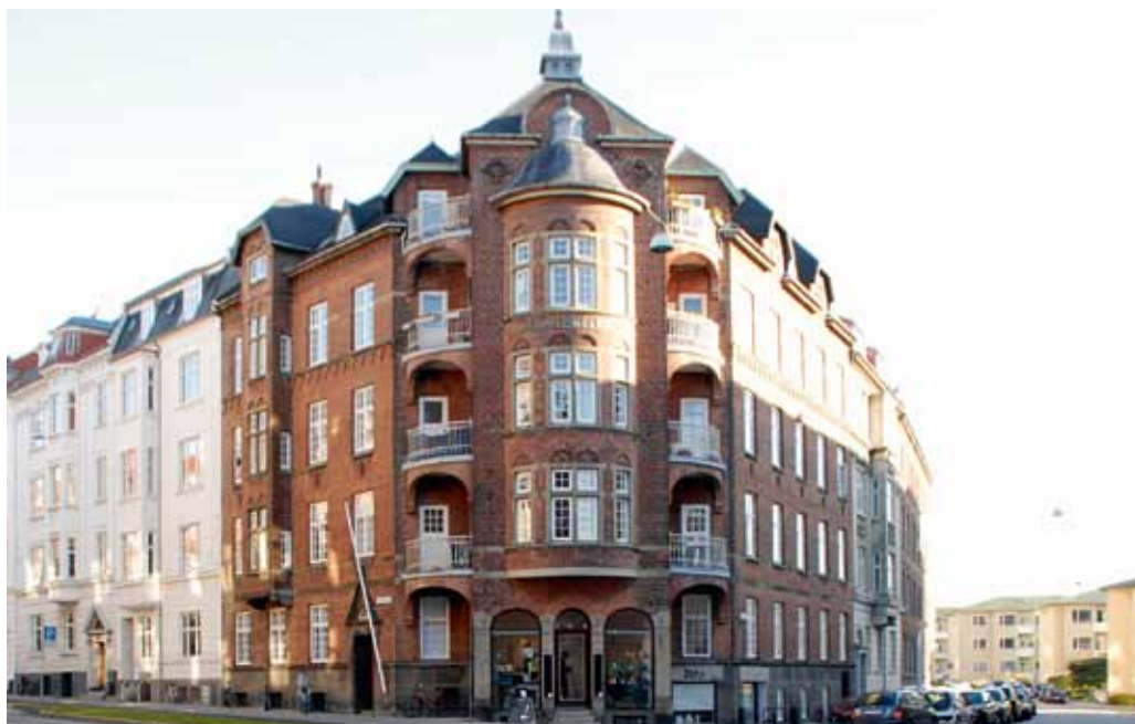
Hjørnehuset på Hans Broges Gade 39 blev opført i 1907. Hjørnekarnaptårnet og det kraftigt formede kvistarangement er tydeligt inspireret af berlinerarkitektur.