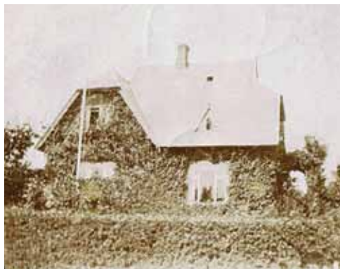
Hjemmet på Paludan-Müllers Vej 4 med vildvinen, der skjulte de mange bygningsdetaljer, da han selv boede i huset. Det blev bygget i 1907, men billedet er noget senere.