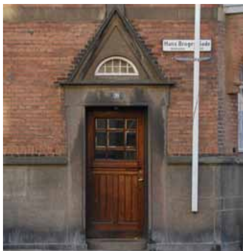
Detalje af dørparti med trekantsfronton.