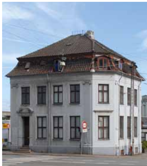
Til Wiers mere karakteristiske bygningsværker hører som nævnt Spanien 65, der med pilastrer (søjlerelieffer), gesims og indgangsparti har mange nyklassisistiske træk.

Da der var mangel på byggejord i det centrale Århus, blev det besluttet, at man i visse dele af byen kunne bygge i højden. Omkring århundredskiftet opførtes derfor mange femetagers ejendomme for at udnytte pladsen mere effektivt i Århus indre by. Wier tegnede og byggede flere af disse ejendomme. Samtidig besluttede man politisk at udbygge allerede eksisterende villakvarterer, og etablere nye i attraktive