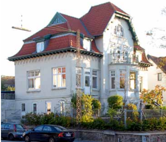
Villaen på Herluf Trolles Gade 6 tegnede og byggede Wier i 1906. Bemærk bl.a. gesimsen og udformningen af de øverste vinduer.

Det kunne afslutningsvis have været interessant at kunne placere Peter Marius Wiers arbejder i en bestemt stilart. Flere stilarter havde indflydelse i tiden: senklassicismen, nyklassicismen og nationalromantikken, men det er vanskeligt entydigt at henføre hans arbejder til nogen af disse grupper, og det er formentlig mest korrekt blot at konstatere, at han var