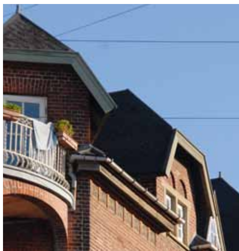
Detalje af kvistparti samt dekorationsfrise under den pudsede gesims. Foto Claus P. Navntoft 2010.